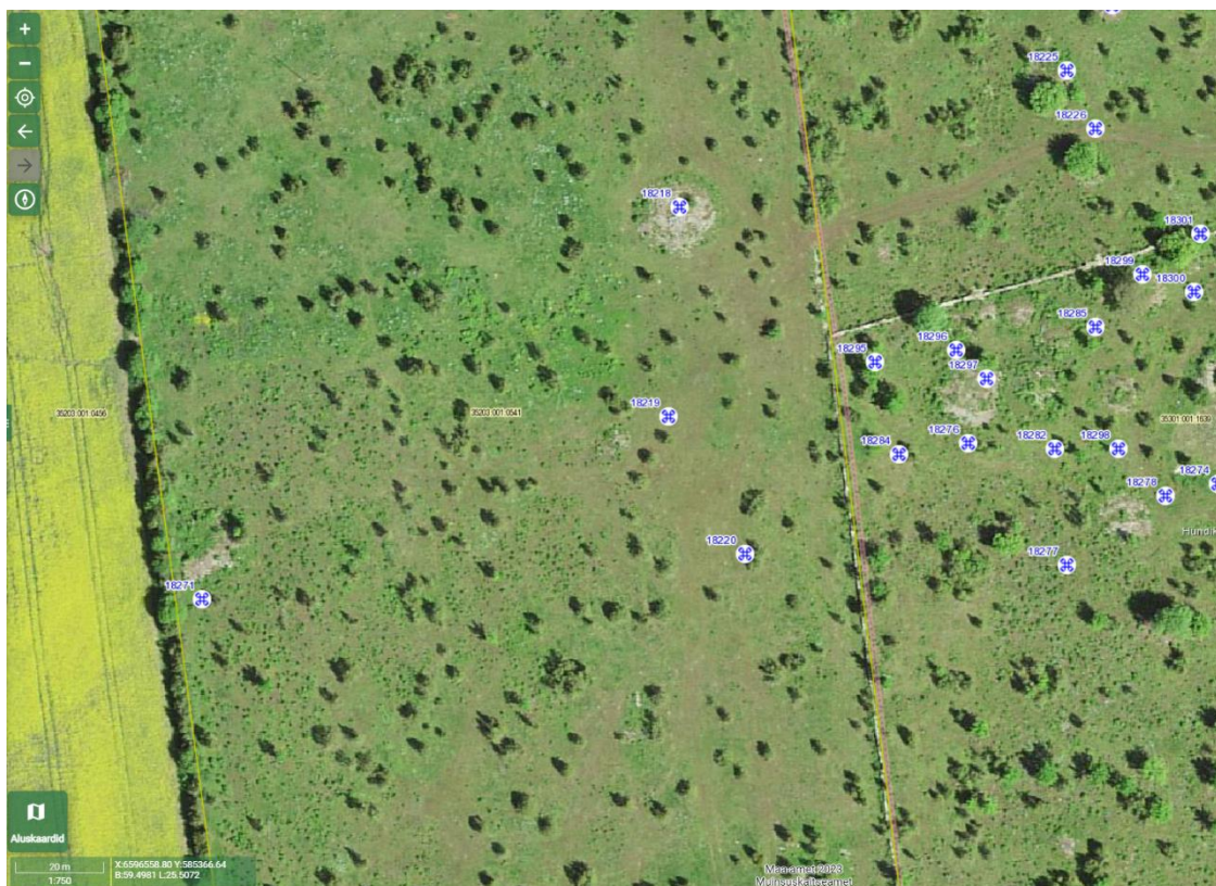
Lisa 1. Kivikalmete reg-nr 18218–18220, 18271 asukohad Maa-ameti kultuurimälestiste kaardikihil seisuga 06.06.2023.